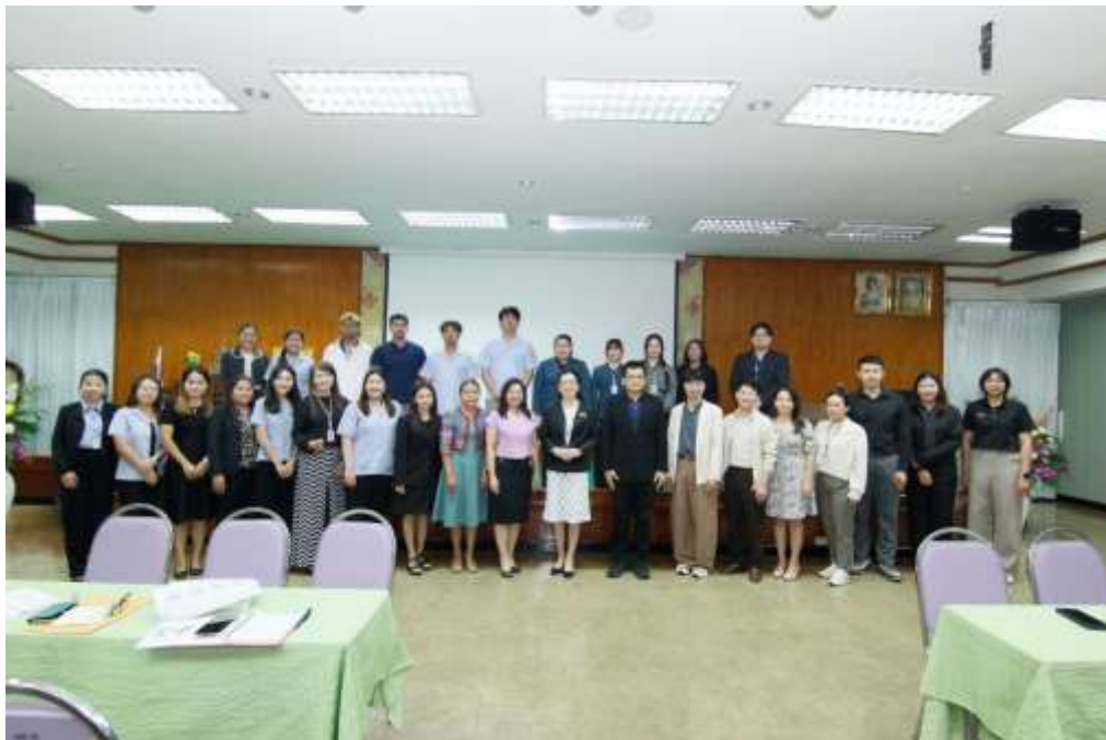
ภาพกิจกรรมการเปิดโอกาสให้บุคคลภายนอกมีส่วนร่วมในการดำเนินงานตามภารกิจ ประจำปี ๒๕๖๙