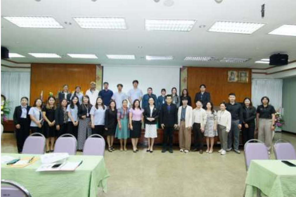
ภาพกิจกรรมการเปิดโอกาสให้บุคคลภายนอกมีส่วนร่วมในการดำเนินงานตามภารกิจ ประจำปี ๒๕๖๙